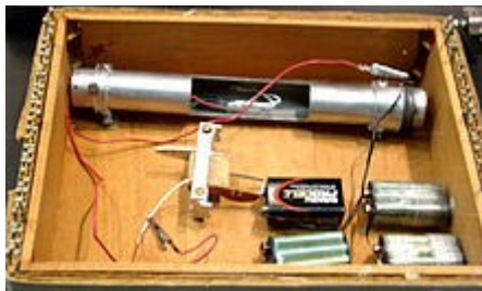
Egy bomba rekonstrukciója

állni: a motorkerékpárok zajára például az útra merőlegesen, fejmagasságban kifeszített húrokkal válaszolt. Az öt felettébb zavaró repülőgépek moraja ellen nincs hatásos védekezés, és átfogó eredményt sem képes elérni kisstílusú szabotázsakciókkal, ebből kifolyólag kezdetleges levélbombák gyártásába kezdett, hogy ekképp ejtsen sebet az öt zaklató technológiai rendszeren, és bosszulja meg a számára oly kedves anyatermeszetet ért támadást. Esszéjében ezt azzal magyarázza, hogy e drasztikus lépésekkel próbálta felhívni magára a tunya átlagember figyelmét. Egy interjúban megemlíti azt a konkrét esetet is, amikor elszakadt benne a cérna: a kedvenc kirándulóhelyére aszfalt utat építettek, megrontva így a gyönyörű tájképet. „El tudják képzelni, milyen ideges lettem? Ott, és akkor elhatároztam, ahelyett, hogy tovább képezném magam a túléléshez szükséges ismeretekkel, behajtom a rendszeren az okozott károm. Visszavágó következik.” *