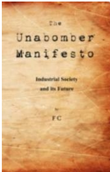
A Manifesto egy nyomtatott kiadása

Theodore John Kazcynski No. 04475-046 US Penitentiary—Max P.O. Box 8500 Florence, CO 8126-8500 USA