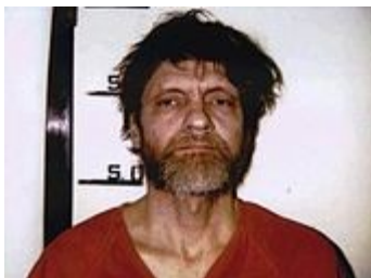
Ted Kaczynski elfogásakor

17 hosszú évnek kellett eltelnie, amíg az FBI a nyomára akadt a terrorista remetének. Az illetékes szervek "UNABOMB" fedőnéven emlegették (mozaikszó: „university and airline bomber”, magyarul egyetem - és repülőgép robbantó), amelyet a sajtó Unabomber-ként interpretált, és így is terjedt el a köztudatban a levélbomba-sorozat mögött álló fantom neve. Több okból kifolyólag sikerült csak ily későn kézre keríteni. Kaczynski először is gyakran hagyott félrevezető nyomokat, hamis üzeneteket és mások ujjlenyomatát a robbanószerkezetek dobozain, ráadásul gyakran az „FC” ( Freedom Club - kezdetben azt hitték, "fucking computers") rövidítést is rájuk írta, ami miatt (teljesen logikus gondolatmenetet követve) egy egész szervezetet, bizonyos Szabadság klubot sejtettek a merényletek mögött, és így több potenciális gyanúsított is szóba került. Kiáltványában is többes számban, Szabadság klubként írja le gondolatait.